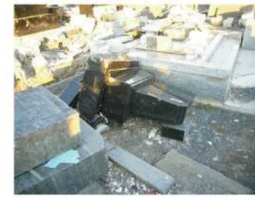
↑耐震施工のお墓も津波の威力にはひとたまりもありません