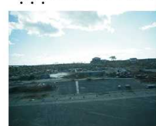
↑海に面した住宅街の風景です。ほとんどの家が流され、野原となっています