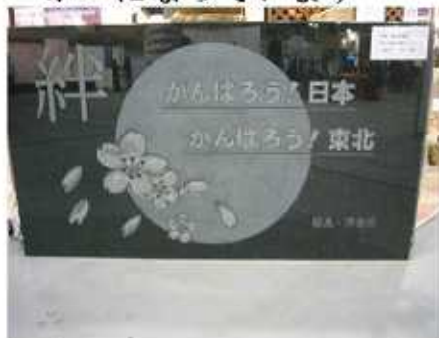
↑会場の至る所で被災地への応援メッセージが見られました。