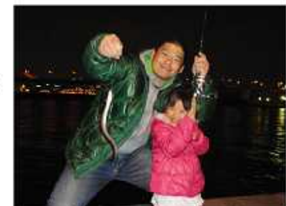
↑アジを狙ってアナゴも釣れ、子供も喜んでいました！