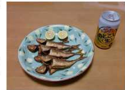
↑ビールのおつまみに最高ですよ！