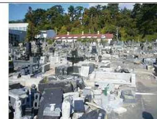
↑今回支援活動を行った墓地の風景です

空白の部分には赤ちゃんやペットがいるなど、ご自宅の状況によって必要なものもあると思いますので書き足してご使用下さい。