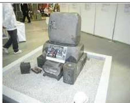
↑石巻市で建てていたお墓を施主様のご厚意により展示させて頂きました。火災にあい、表面がボロボロになっています

また近年徐々に人気が出てきています商品、『石あかり』の展示（写真一番下）もあり、見る人を楽しませてくれました。お客様にも良いアイデアなどがありましたら、是非お聞かせ下さい！また実物が見たいと思われた方は、12月17日から25日の17:00~22:00、中之島一帯で展示されていますので是非一度ご覧になって下さい。今後も皆様に少しでも喜んで頂ける石材店を目指して2ヵ月に1度、研修会をしていく予定です(^_^)