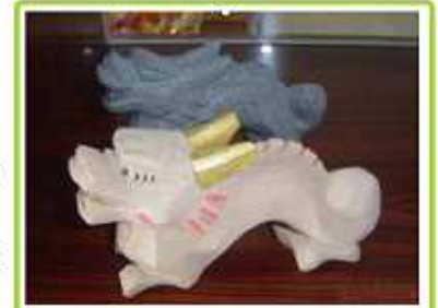
お電話・fax・eメールで 受け付けております

今年も大好評干支の置物シリーズの季節がやって参りました。今回は砂岩(手前)と御影石(奥)で作られたカッコイイ龍の置物です。大きさは15センチ程度で置き場所を選ばず飾って頂けます。今年のウサギの置物より加工に手間が掛かっている分、少しお値段が上がってしまいますが、来年の皆様の運氣上昇を願ひまして、通常3,500円の所、通信特別価格2,600円にて販売させて頂きます。