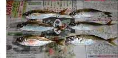
↑釣り上げたばかりのアジです！