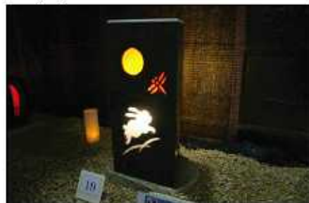
↑石あかりの展示が来場者を楽しませてくれました。