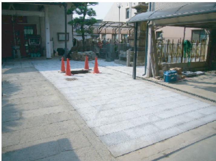
お寺様境内土間石貼り工事(堺区)