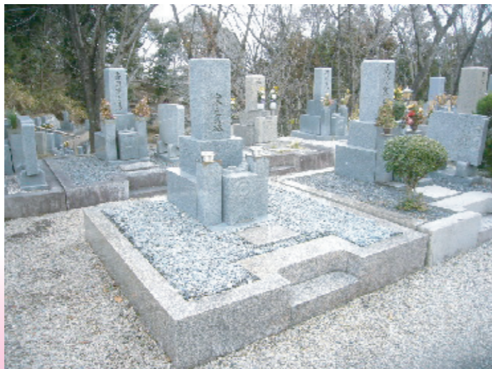
(施工後) お墓の傾き直し、巻石の外れている部分の据え直し、ツゲの撤去、玉砂利の入替