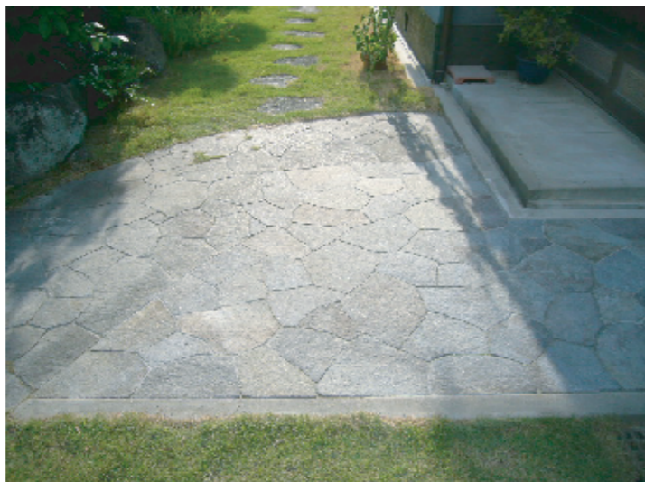
玄関前アプローチの鉄平石貼り延長工事 (大阪狭山市)