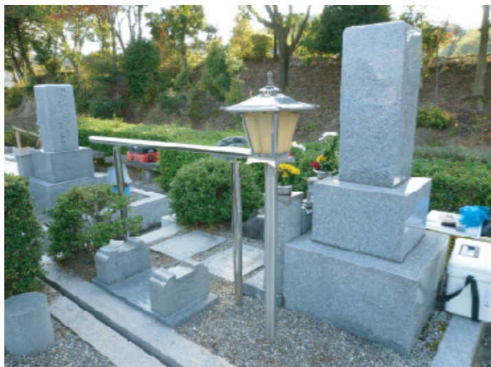
墓所内手摺り取り付け工事(鉢ヶ峯公園墓地)