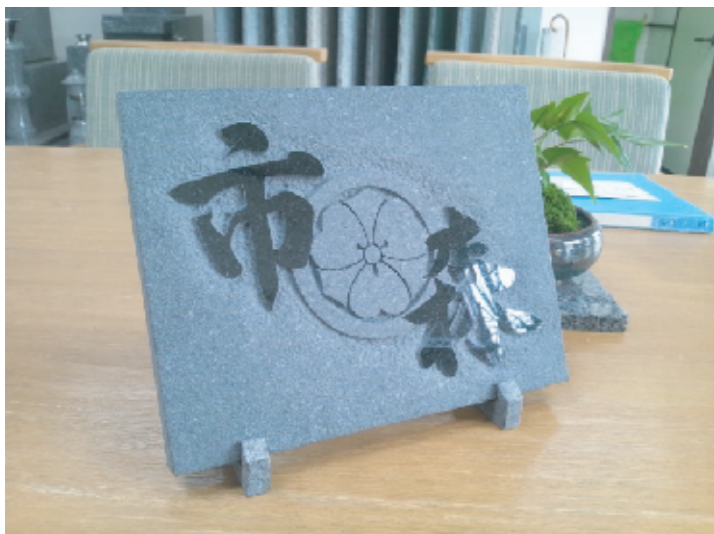
オーダーメイド表札の制作